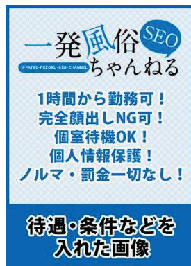
待遇・条件などを入れた画像