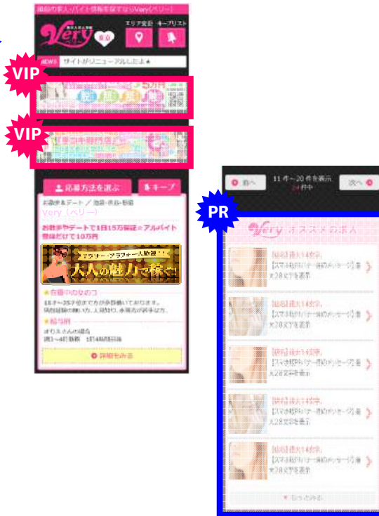
スマホ版 検索一覧ページ