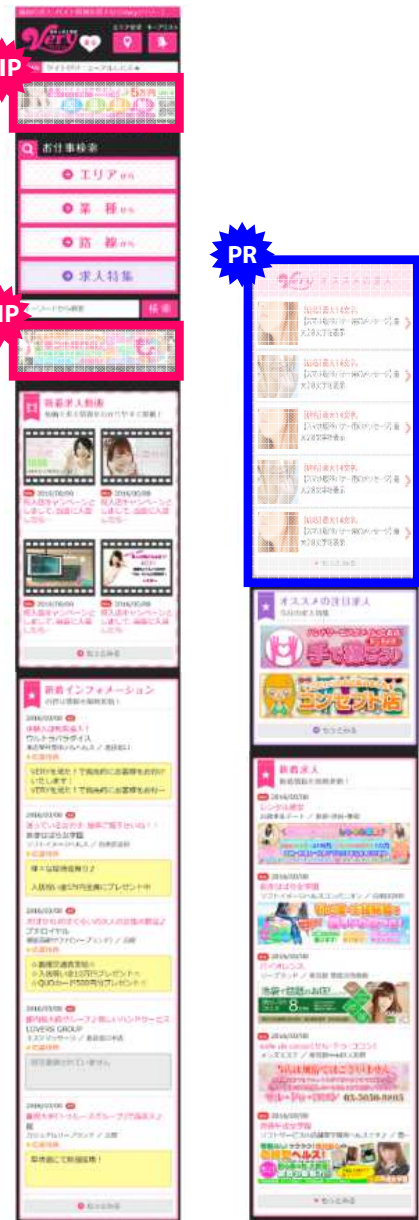
スマホ版 トップページ